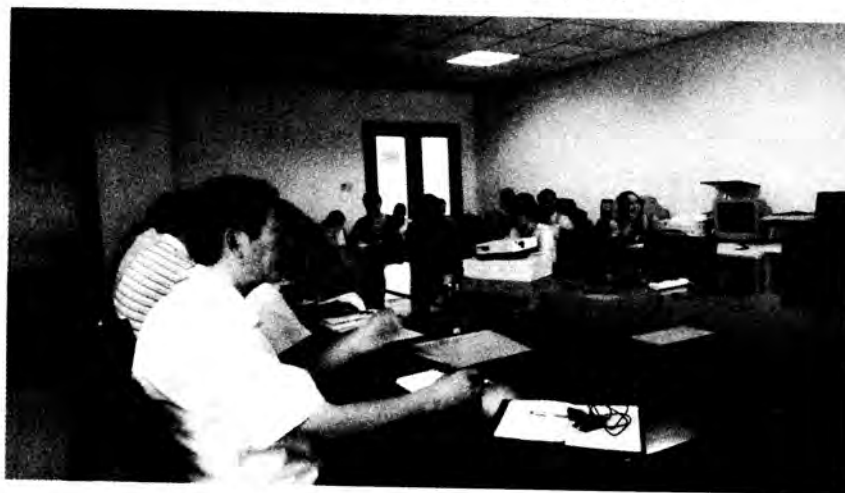
聘请我校党课知名专家开展党课专题研讨会