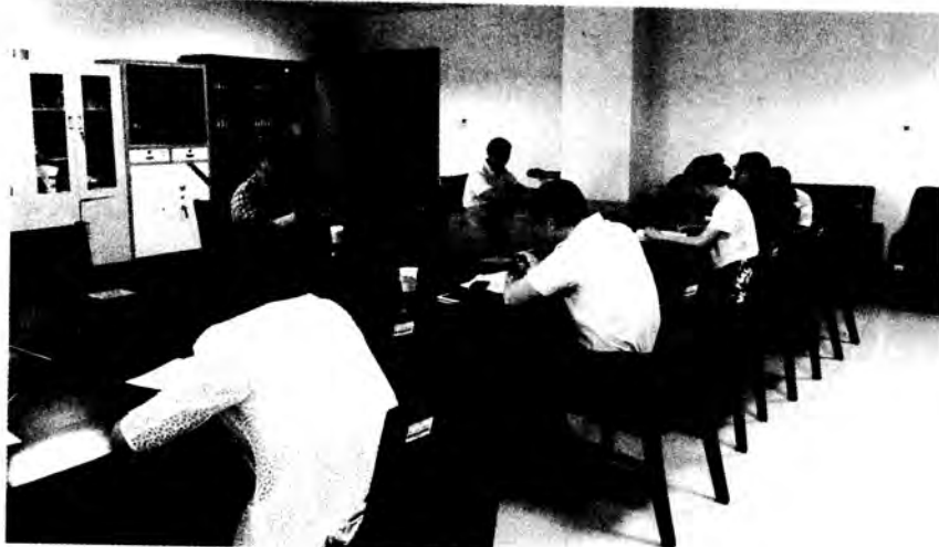
聘请校外知名专家开展党课教学指导工作