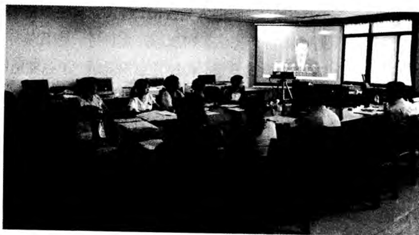
收看习近平总书记高校思想政治工作会议上的重要讲话视频